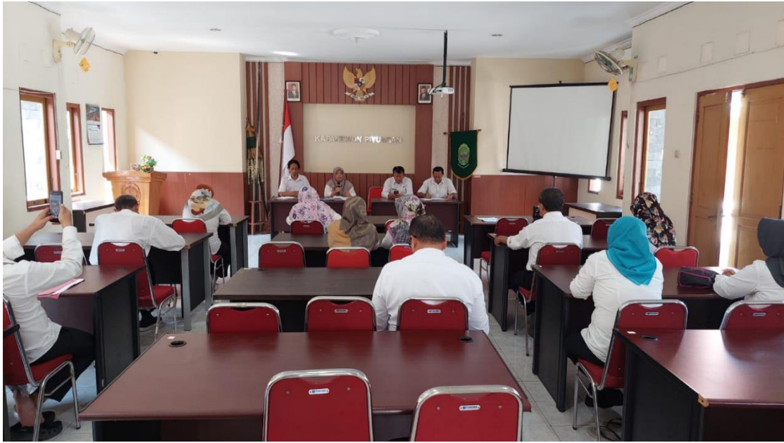
Rakor Internal Terkait Pengelolaan PPID Kapanewon tahun 2023