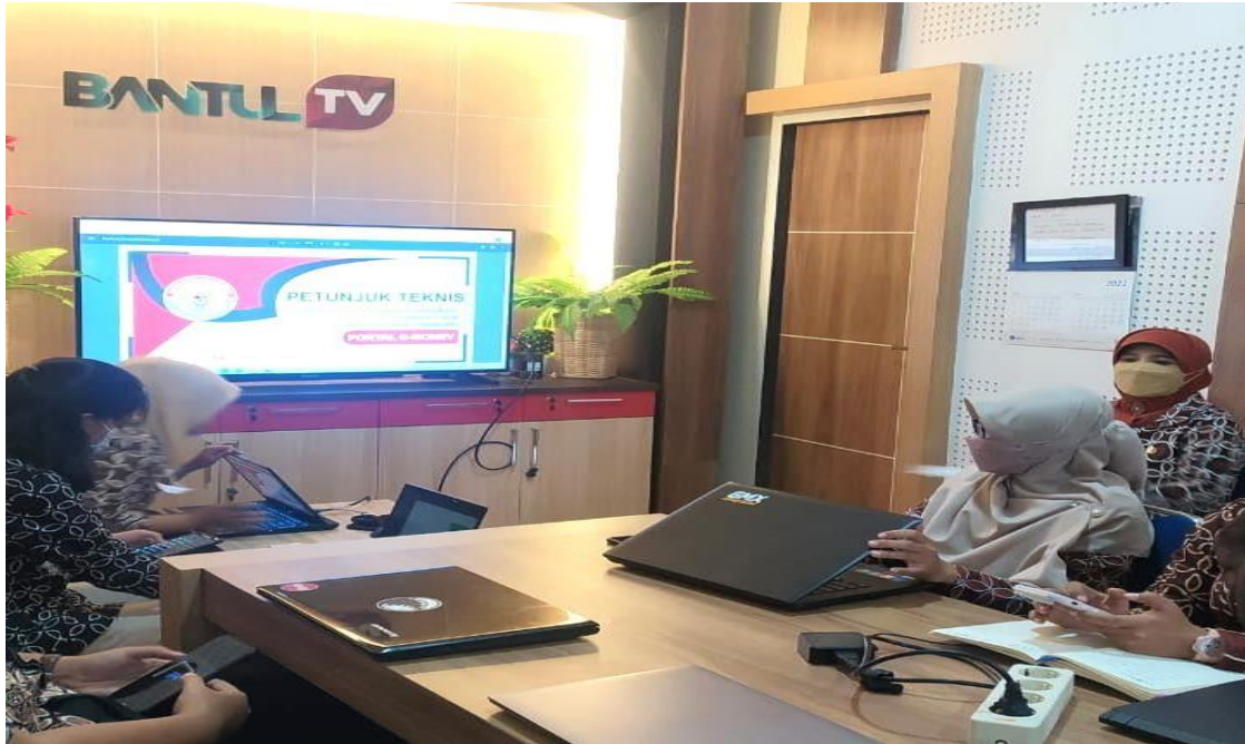
Mengikuti Pertemuan Pemaparan Petunjuk Teknis Monitoring dan Evaluasi Keterbukaan Informasi