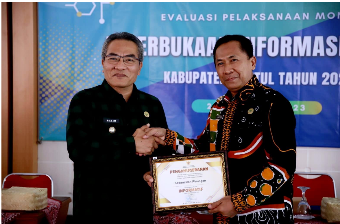
Menghadiri Acara Penyerahan Penghargaan Keterbukaan Informasi Publik Oleh Bupati Bantul Kepada Ketua PPID Kapanewon Piyungan Raih Nilai 100 dalam Kategori Kapanewon Terinformatif tahun 2023