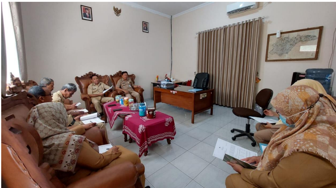
Rakor Internal Terkait Pengelolaan PPID Kapanewon tahun 2023