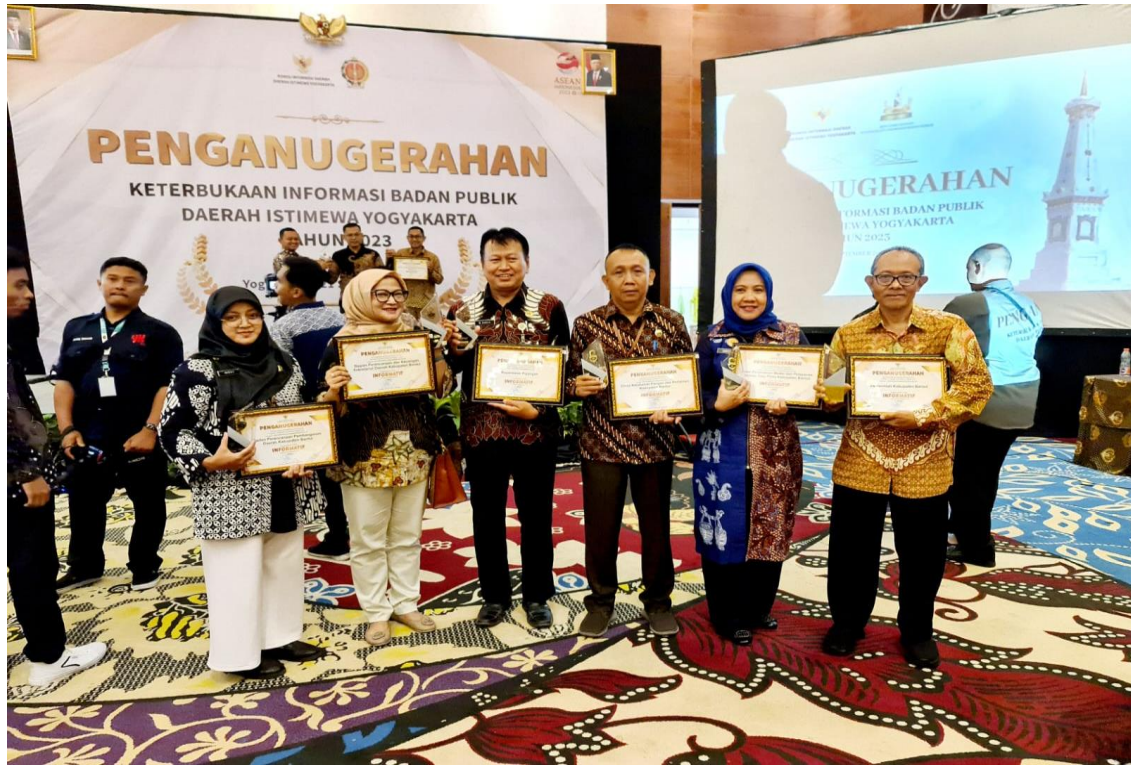
Menghadiri Acara Penganugerahan Keterbukaan Informasi Publik ( Kapanewon Piyungan Raih Nilai 100 dalam Kategori Kapanewon/Kemantren Terinformatif tahun 2023 Tingkat DIY )