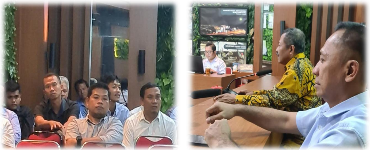
Pelaksanaan Pendampingan Ketua PPID Kapanewon Piyungan bersama Jajaran di Kalurahan Srimulyo Menuju Tingkat Nasional