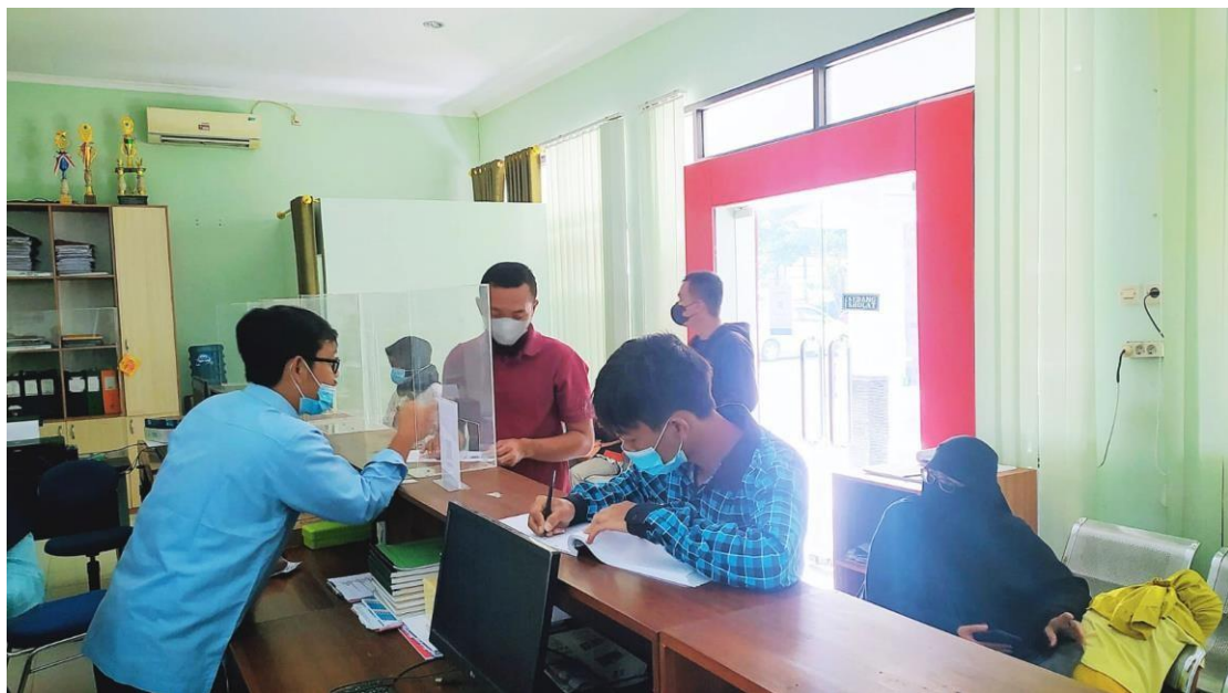
Kegiatan Pelayanan Permintaan Informasi di Kapanewon