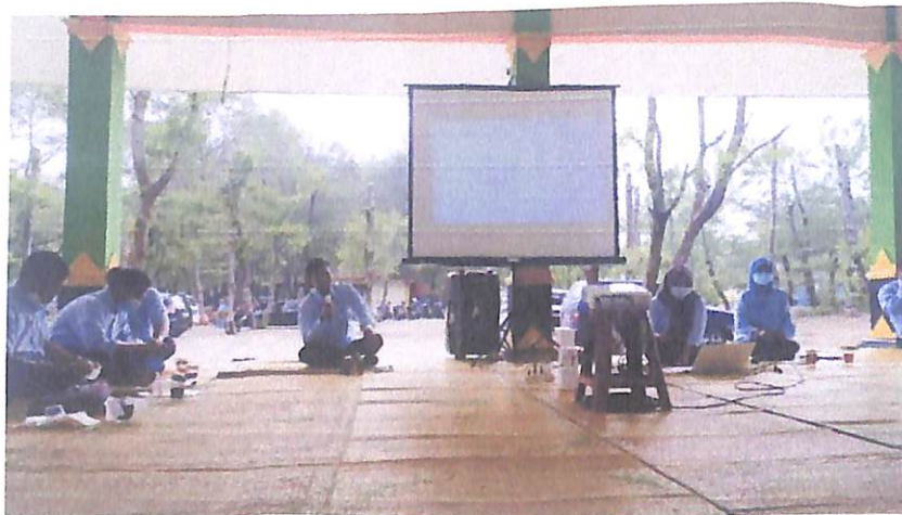
Mengikuti Pertemuan Penyusunan Daftar Informasi Publik (DIP)