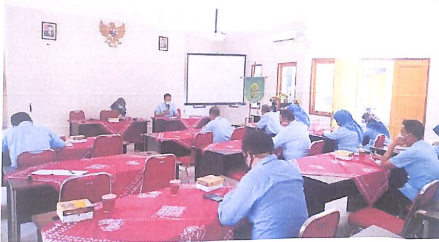
Rakor Internal Terkait Pengelolaan PPID Kapanewon